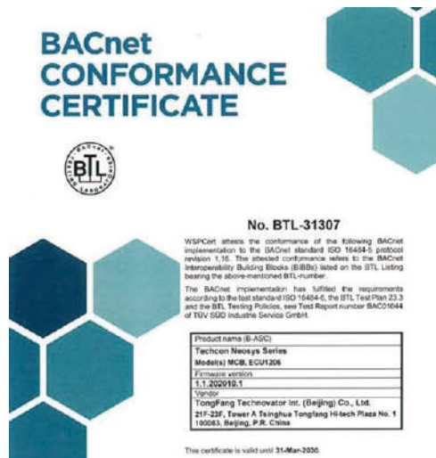
BTL(BACnet Testing Laboratories)認證證書